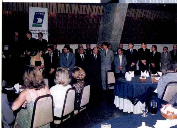
Ato de posse da nova diretoria

O LOJISTA registra neste número alguns momentos daquela noite, que entra para a história do movimento lojista piauiense como um momento de muita importância, principalmente porque representa a força da categoria e a sua união em torno de um projeto amplo, que é fazer do comércio lojista do Piauí uma fonte de grande impulso para o desenvolvimento de toda a sociedade e, acima de tudo, porque mostra que a renovação de lideranças continua sendo um dos maiores trunfos que o movimento lojista do Piauí possui.