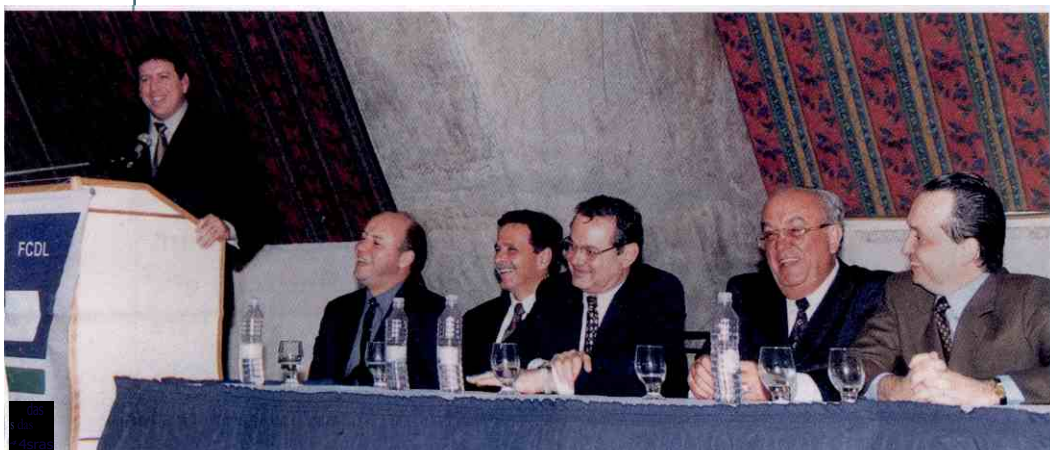
Discurso de posse empolga os presentes

Estado, líderes empresariais de diversos setores e políticos ilustres prestigiaram a solenidade, que transcorreu num clima de confraternização muito bom entre os presentes.