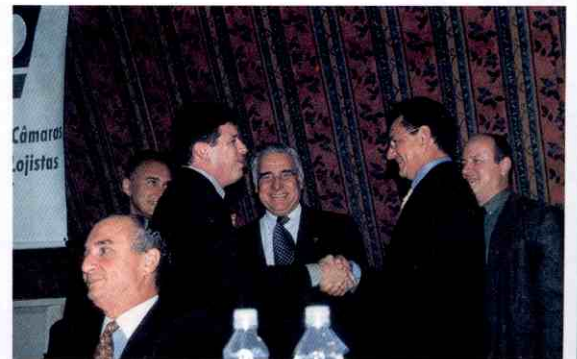
Líderes de entidades de classe cumprimentam o novo presidente